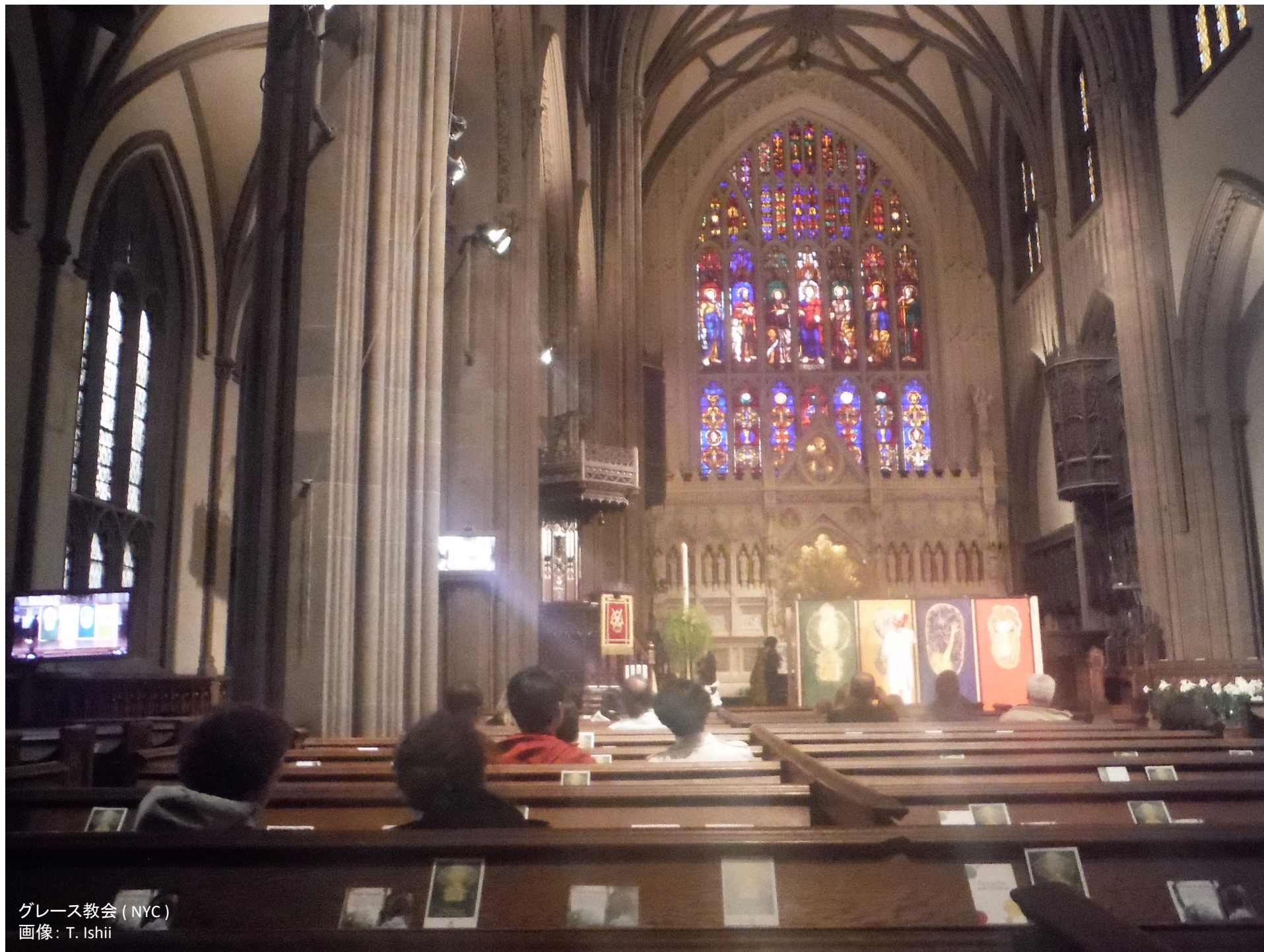
グレース教会 (NYC)