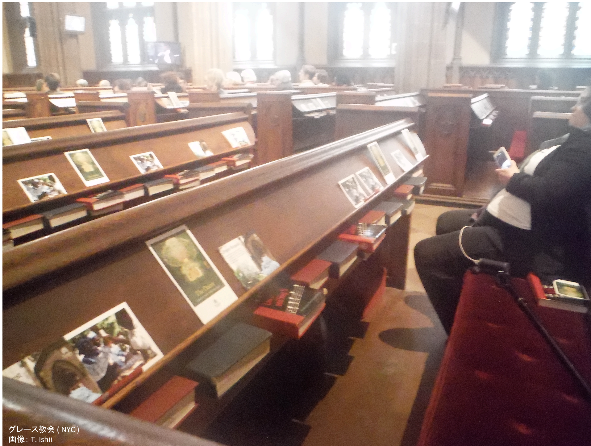
グレース教会 (NYC)