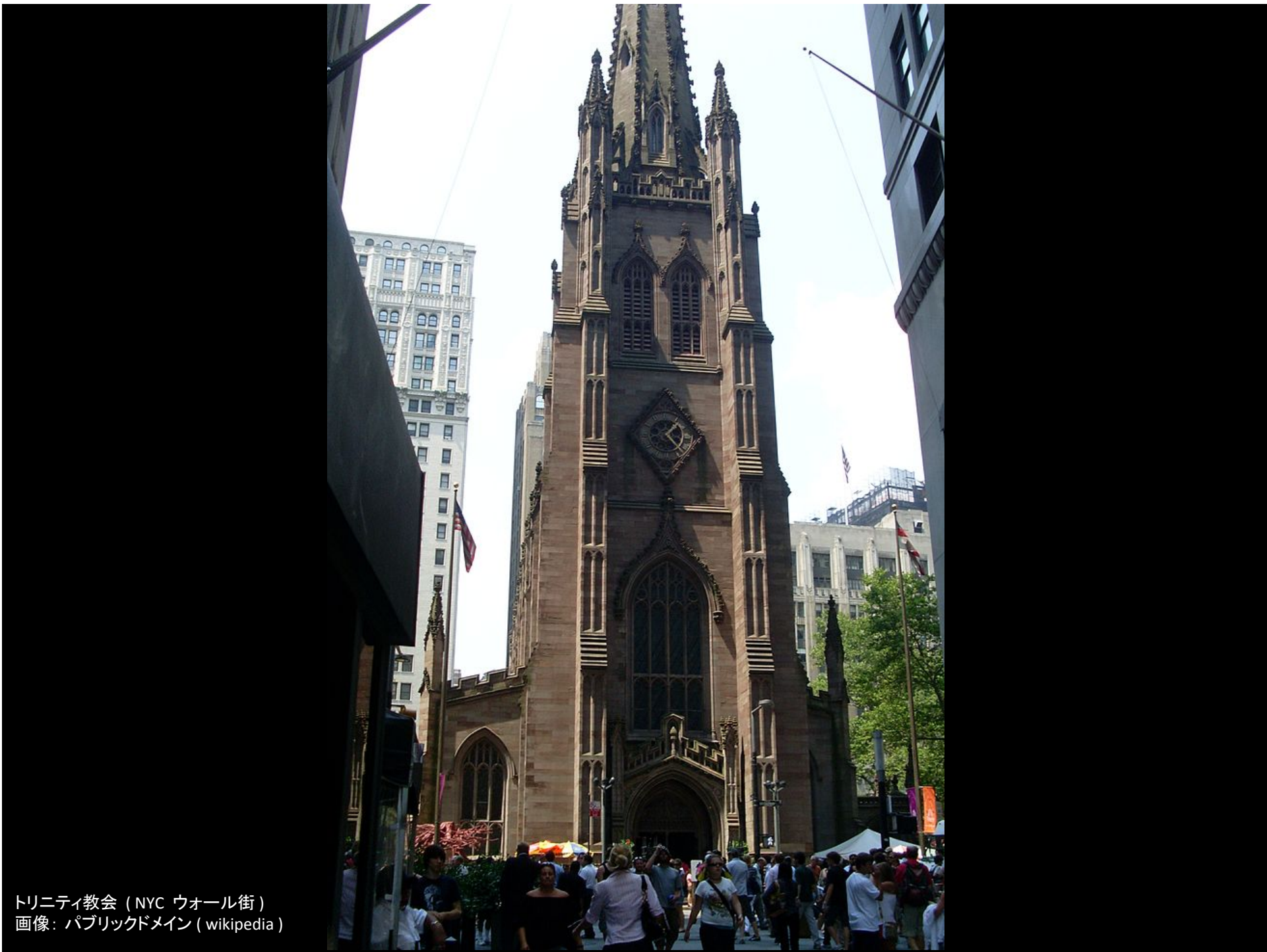
トリニティ教会 (NYC ウォール街)