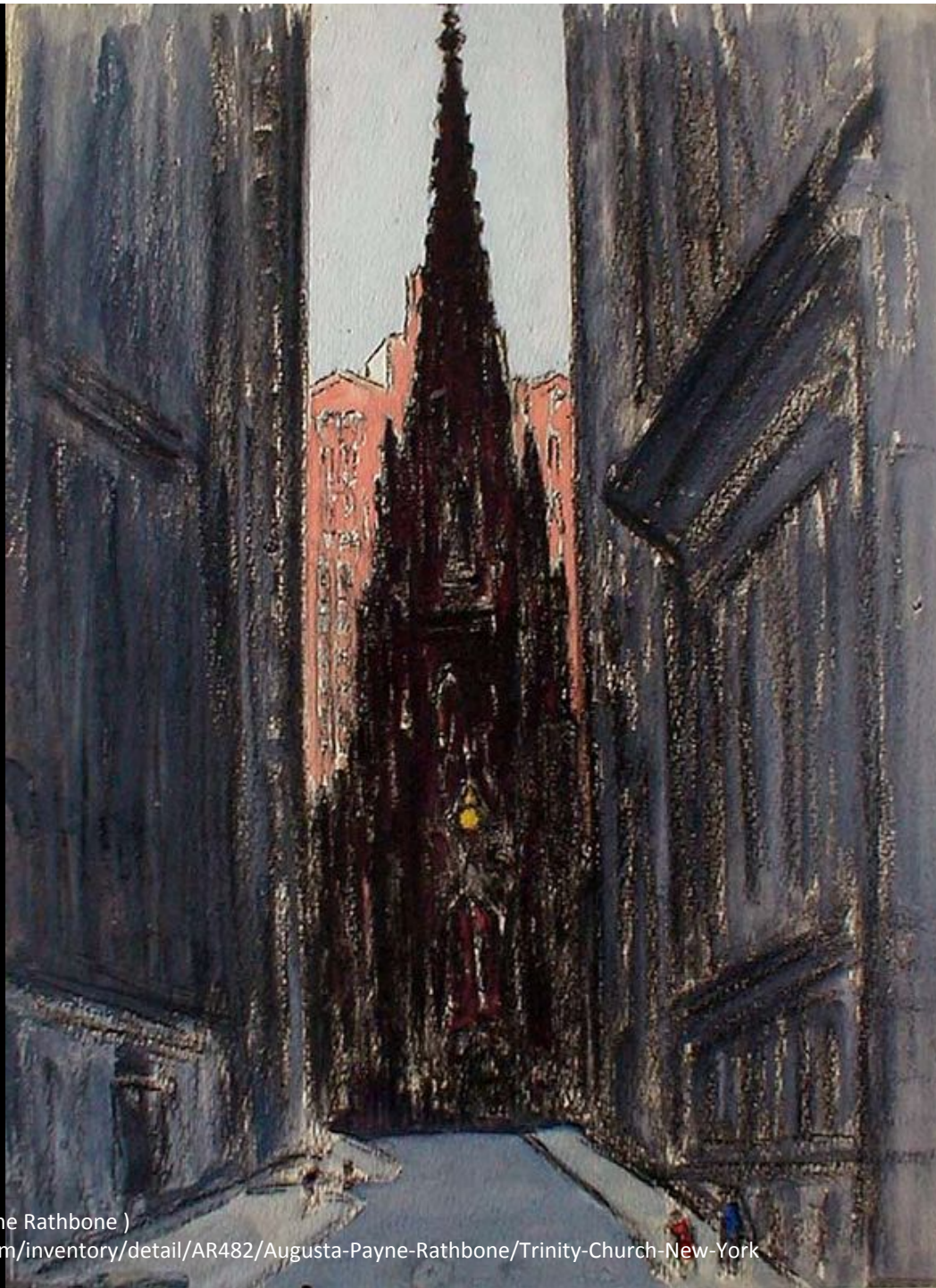
“Trinity Church” ( 絵 : Augusta Payne Rathbone )

画像: https://www.annegalleries.com/inventory/detail/AR482/Augusta-Payne-Rathbone/Trinity-Church-New-York