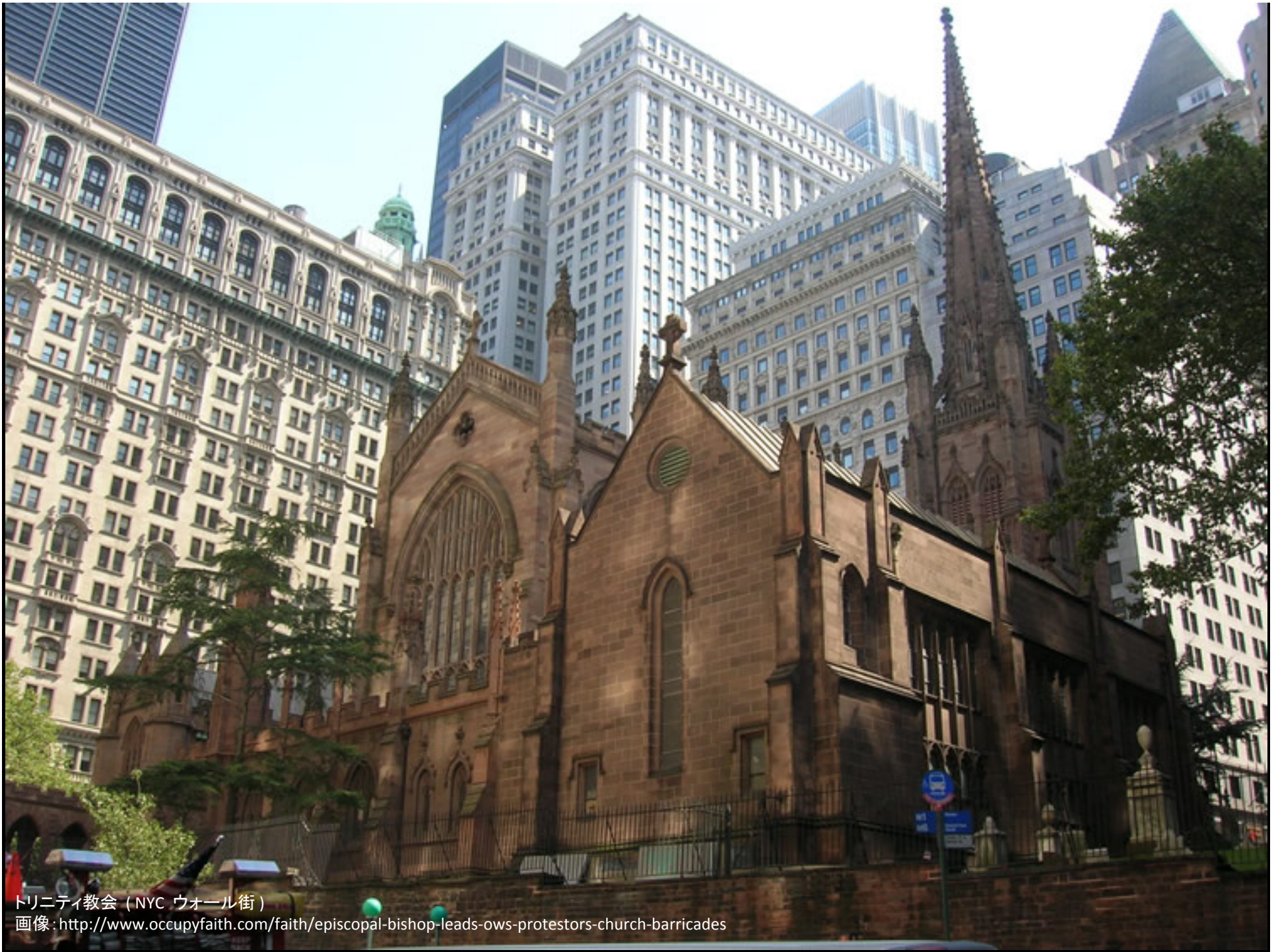
トリニティ教会 (NYC ウォール街)