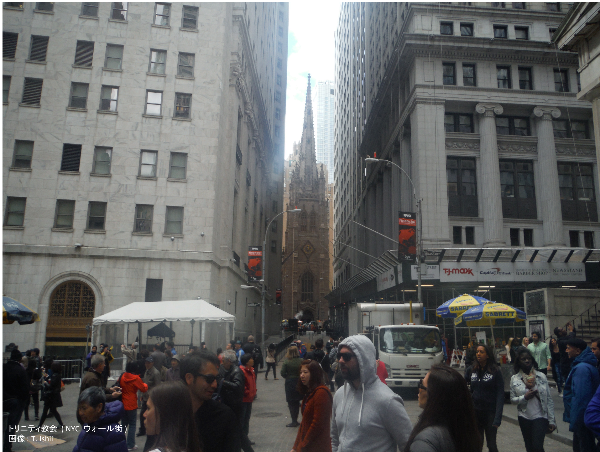
トリニティ教会 (NYC ウォール街)