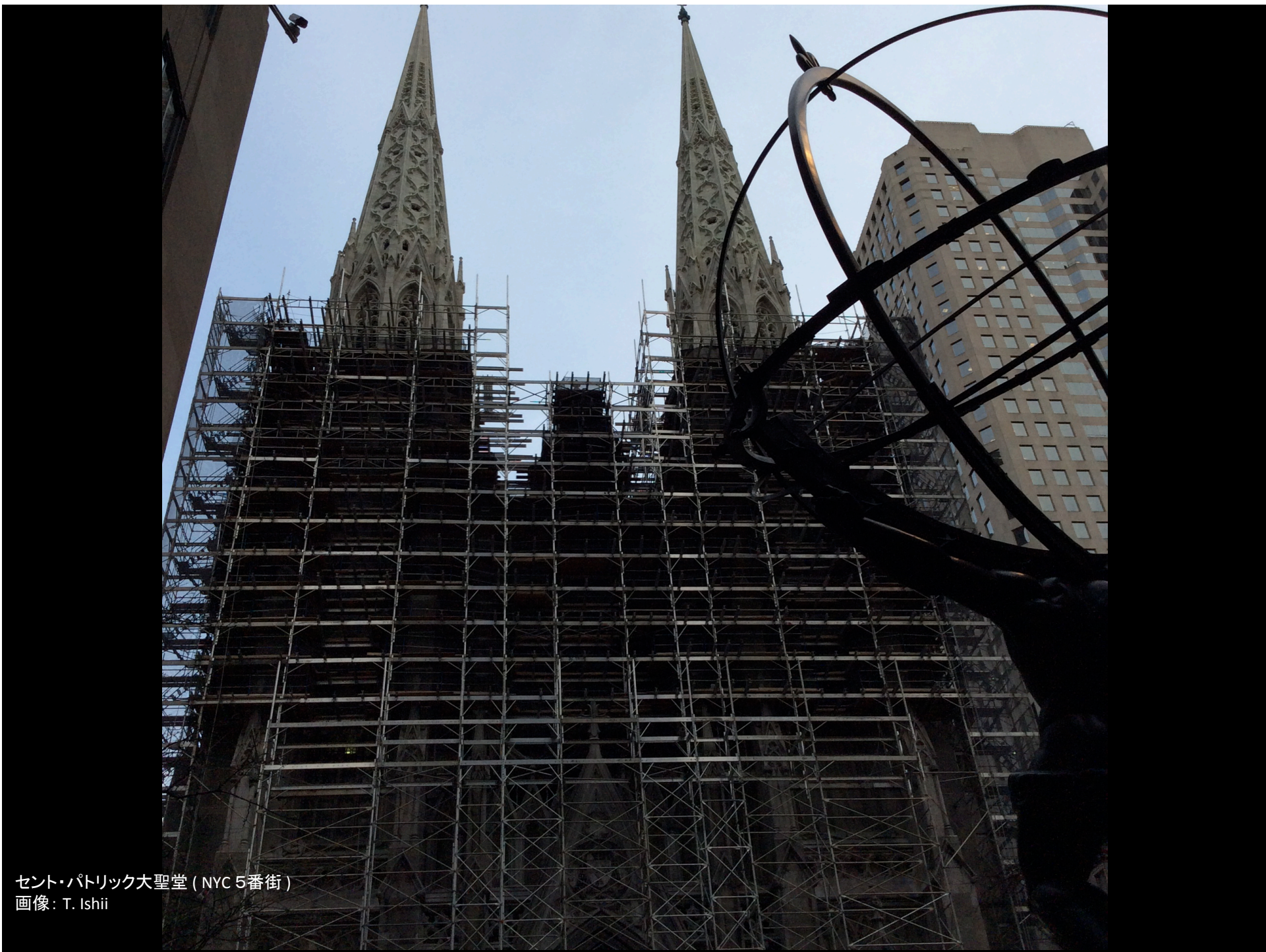
セント・パトリック大聖堂 (NYC 5番街)