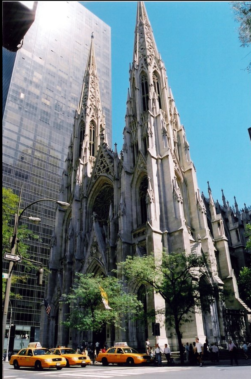
セント・パトリック大聖堂 (NYC 5番街)