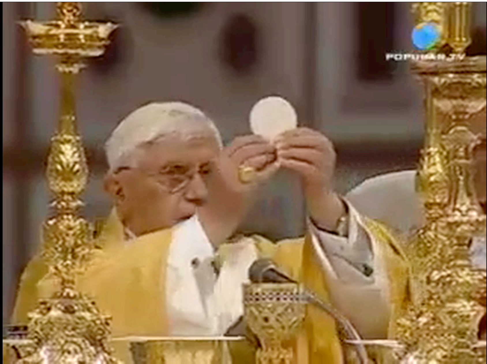
「サンピエトロ大聖堂」(ヴァチカン)での「ミサ」より、「感謝の典礼」と「交わりの儀」の部分。 先代のローマ教皇 ヴェネデクト 16世による。(4分程度)