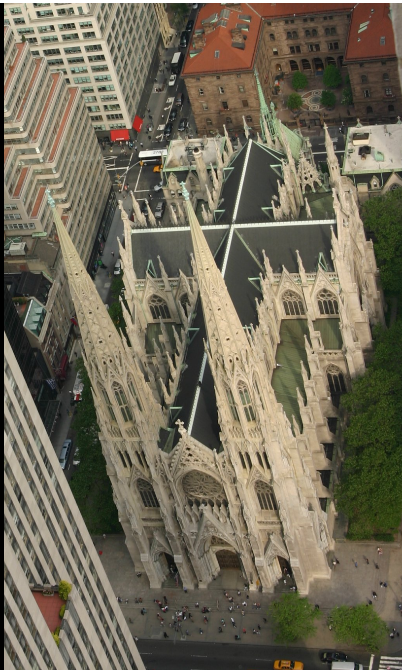
セント・パトリック大聖堂 ( NYC 5番街 )