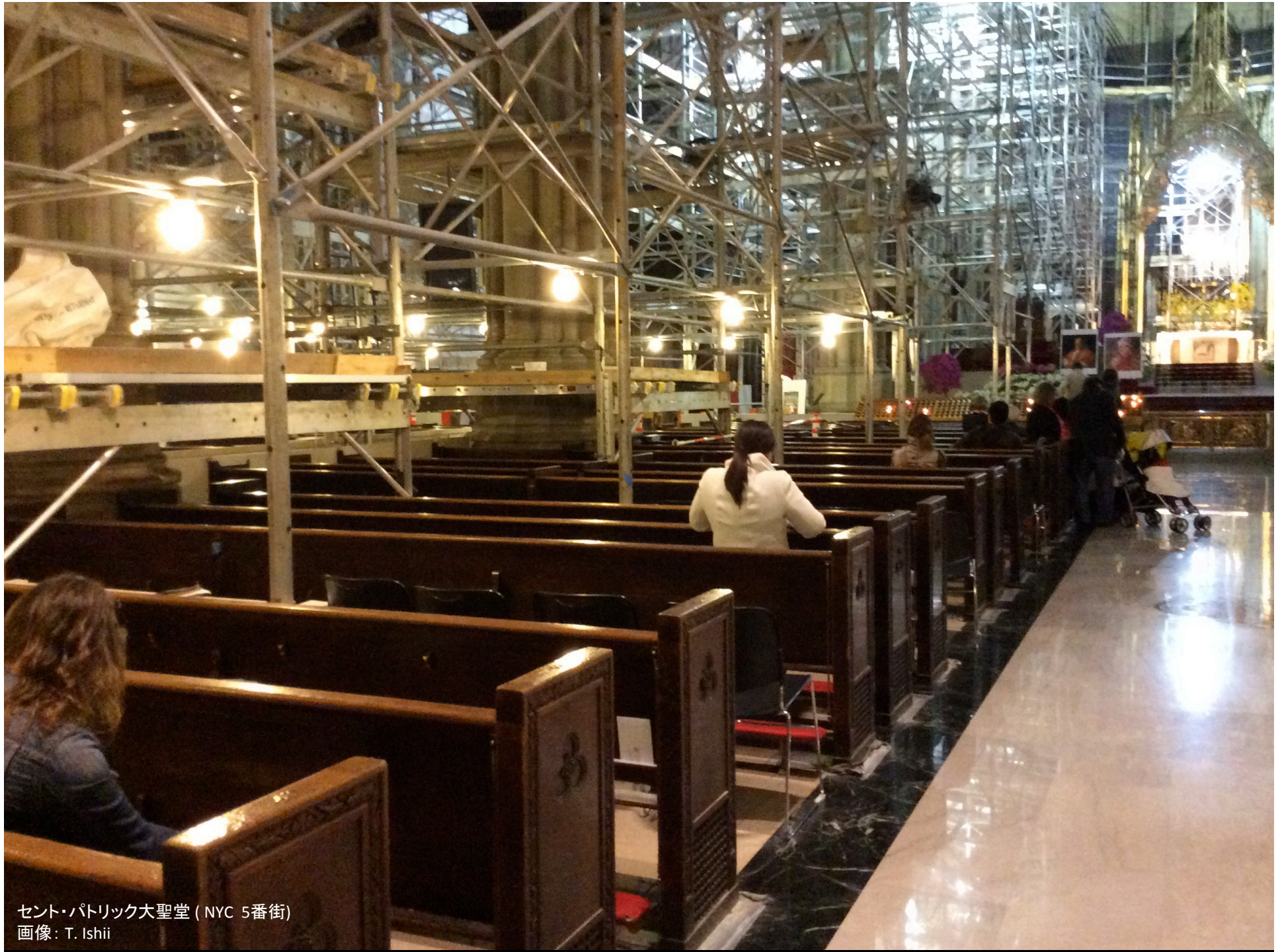
セント・パトリック大聖堂 (NYC 5番街)