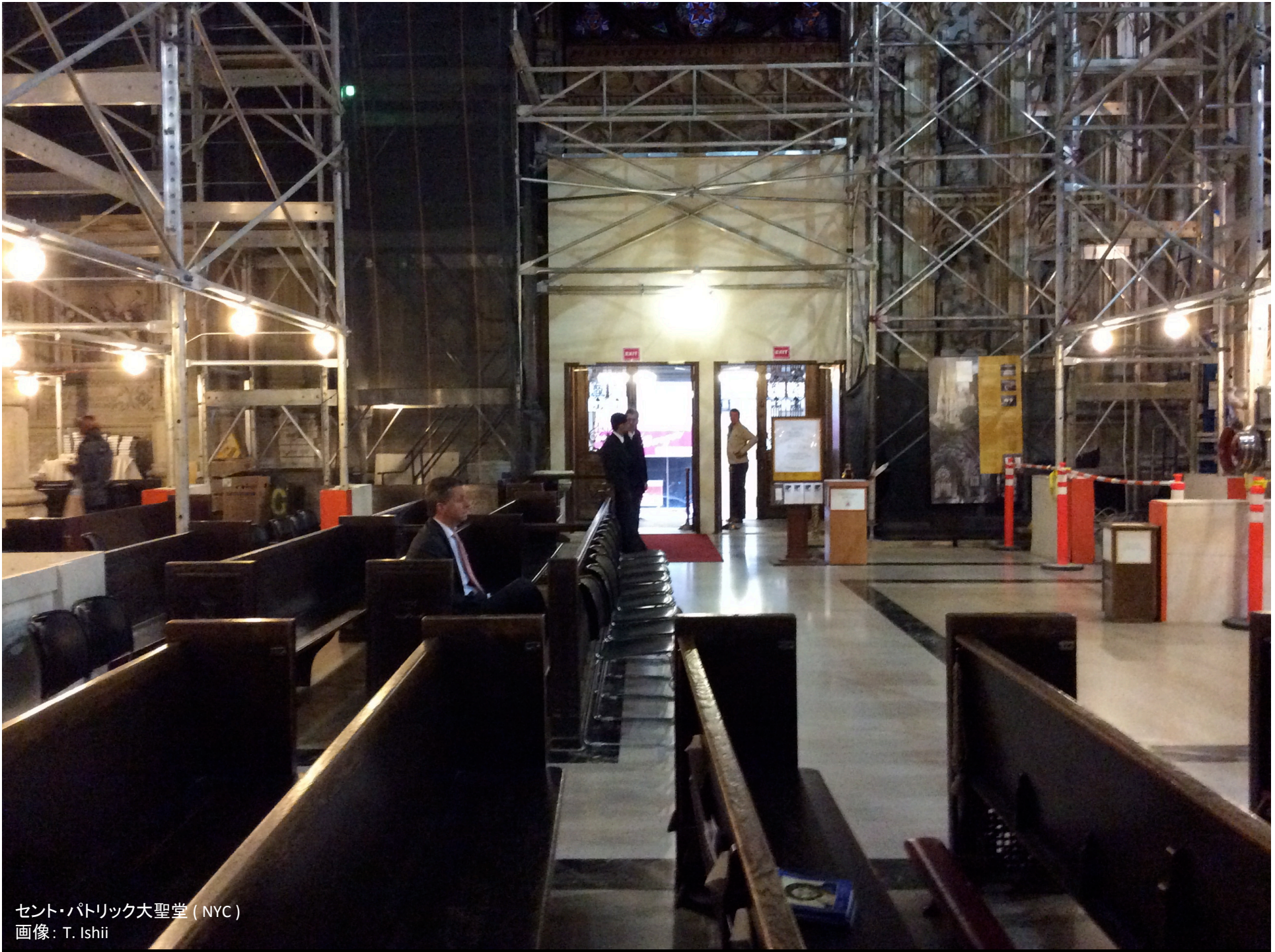
セント・パトリック大聖堂 (NYC)