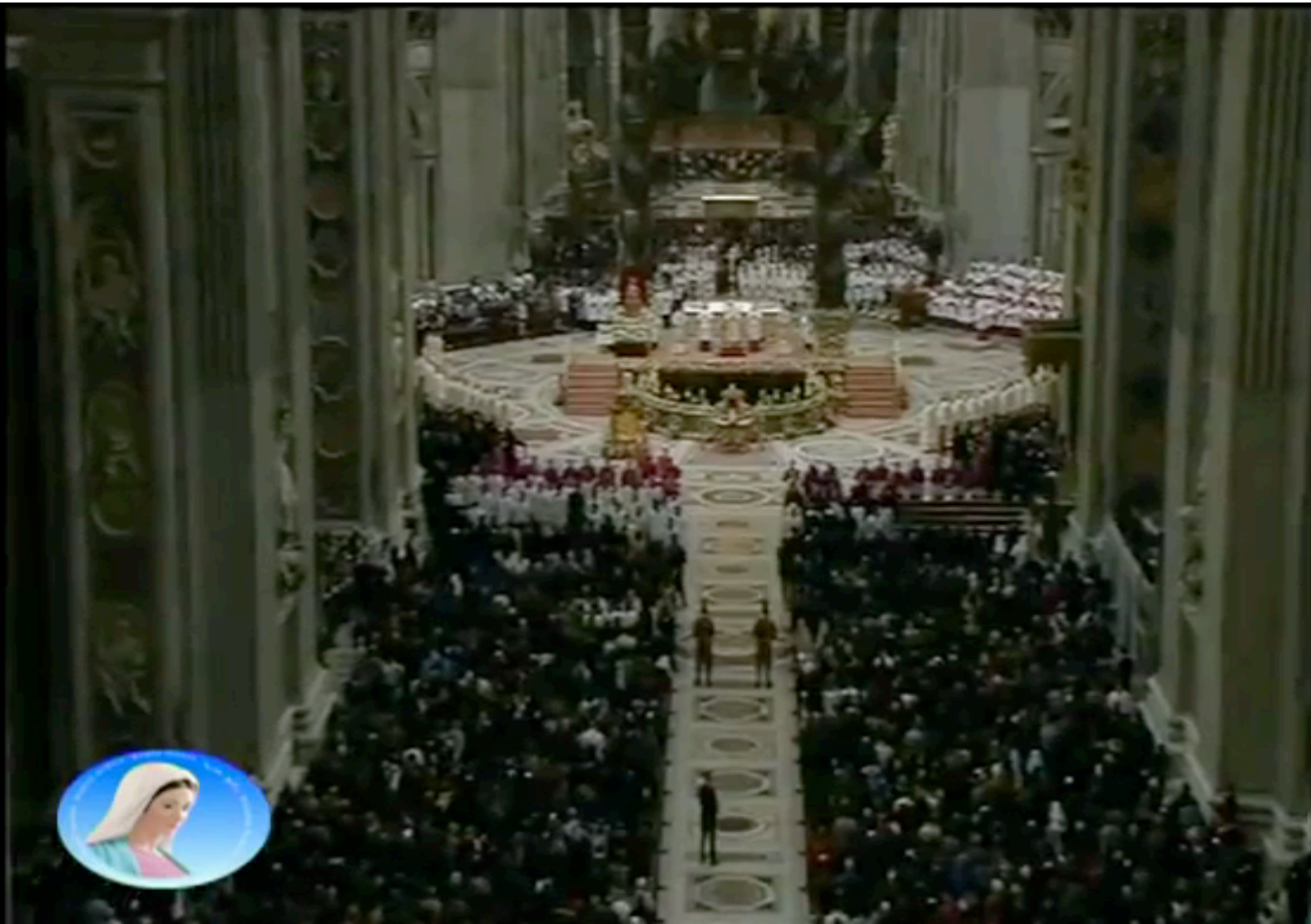
「サンピエトロ大聖堂」(ヴァチカン)での「ミサ」で歌われる「キリエ・エレイソン」(映像 3:00程度)