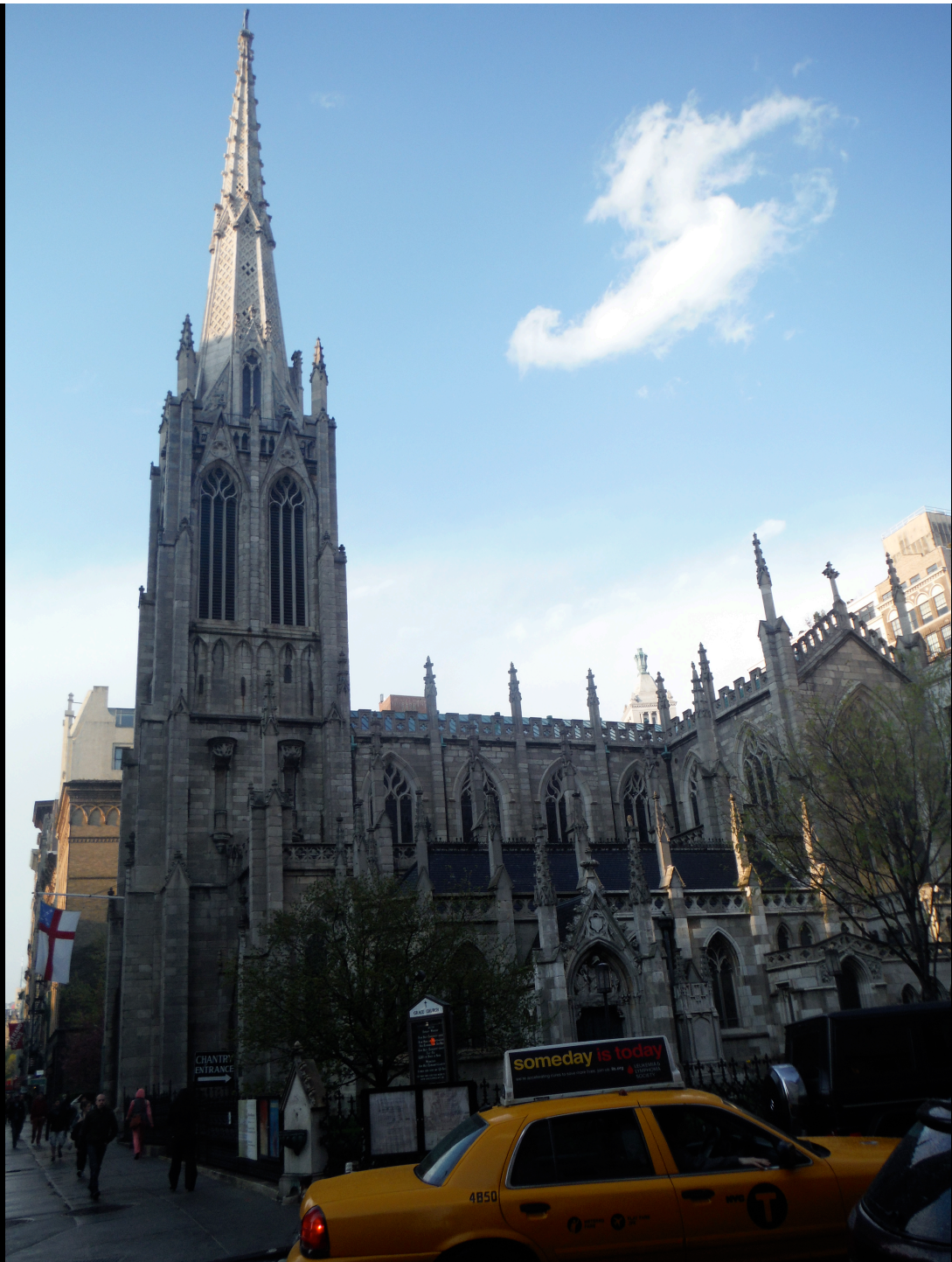
グレース教会 (NYC)