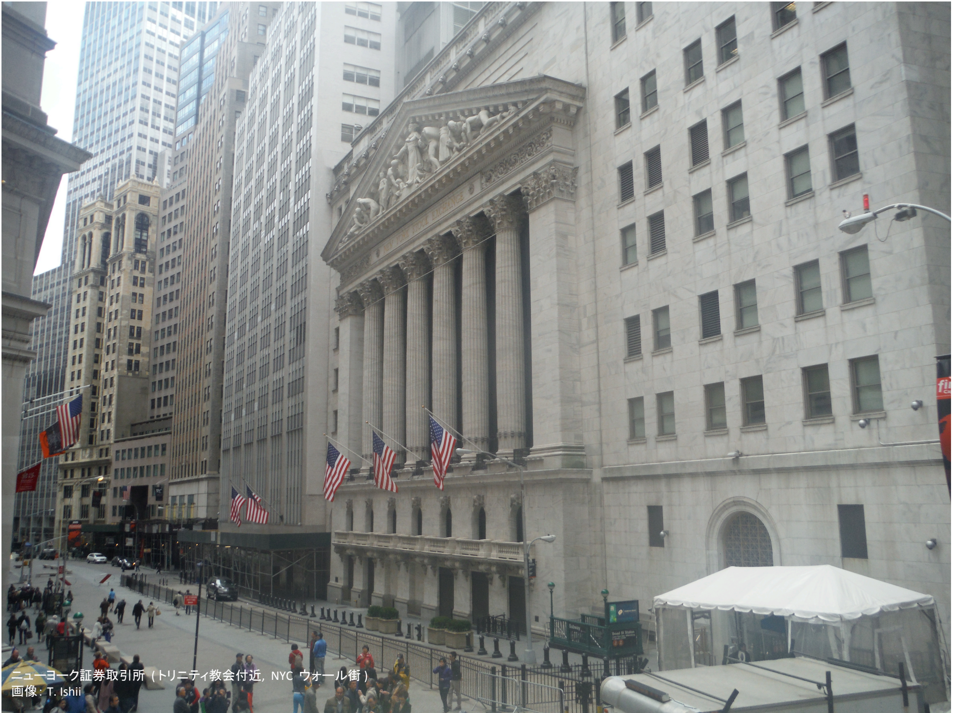
ニューヨーク証券取引所 (トリニティ教会付近, NYC ウォール街)