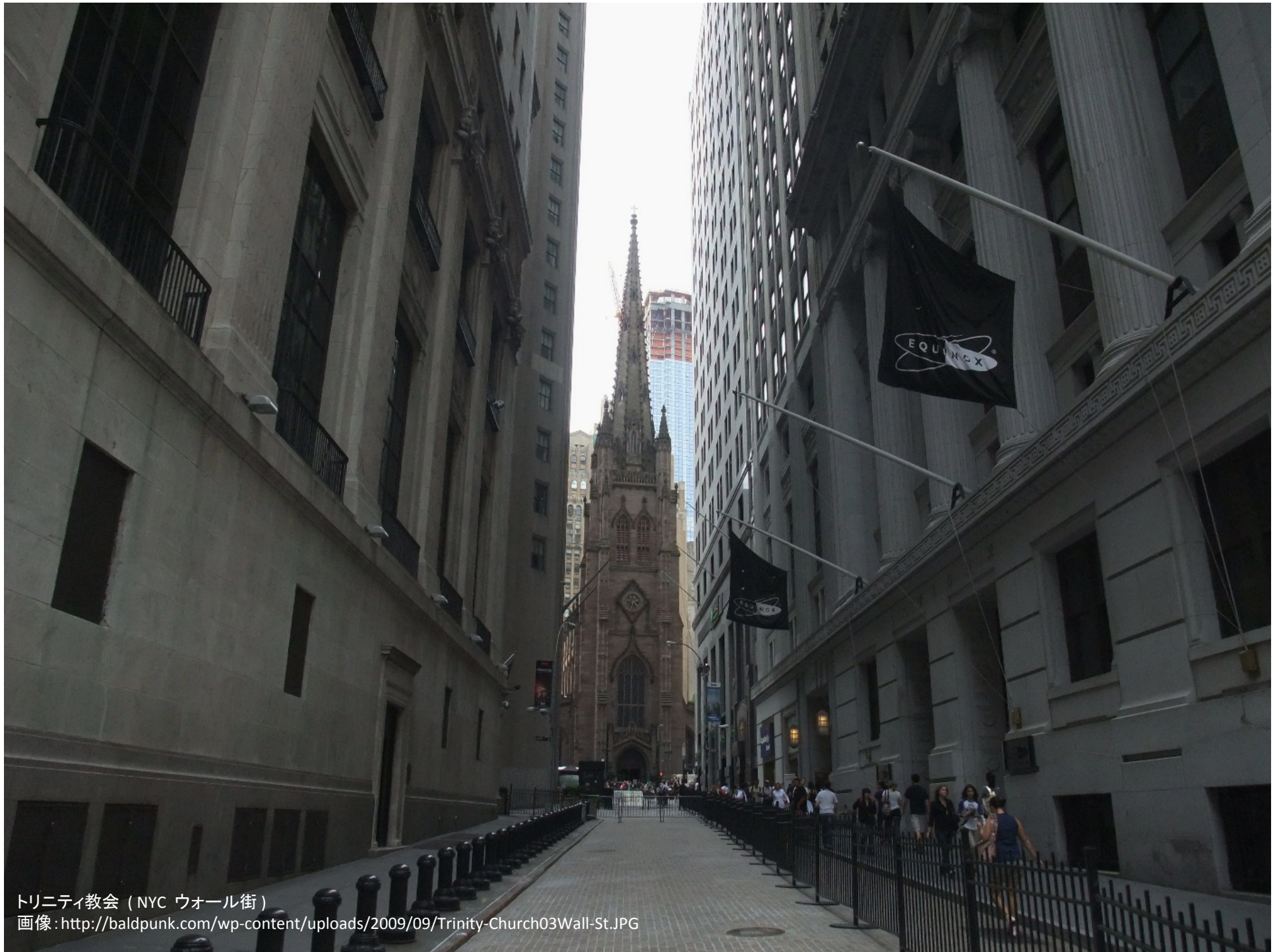
トリニティ教会 (NYC ウォール街)