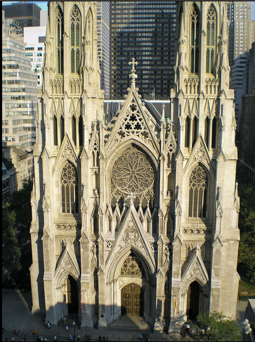
セント・パトリック大聖堂 (NYC 5番街)