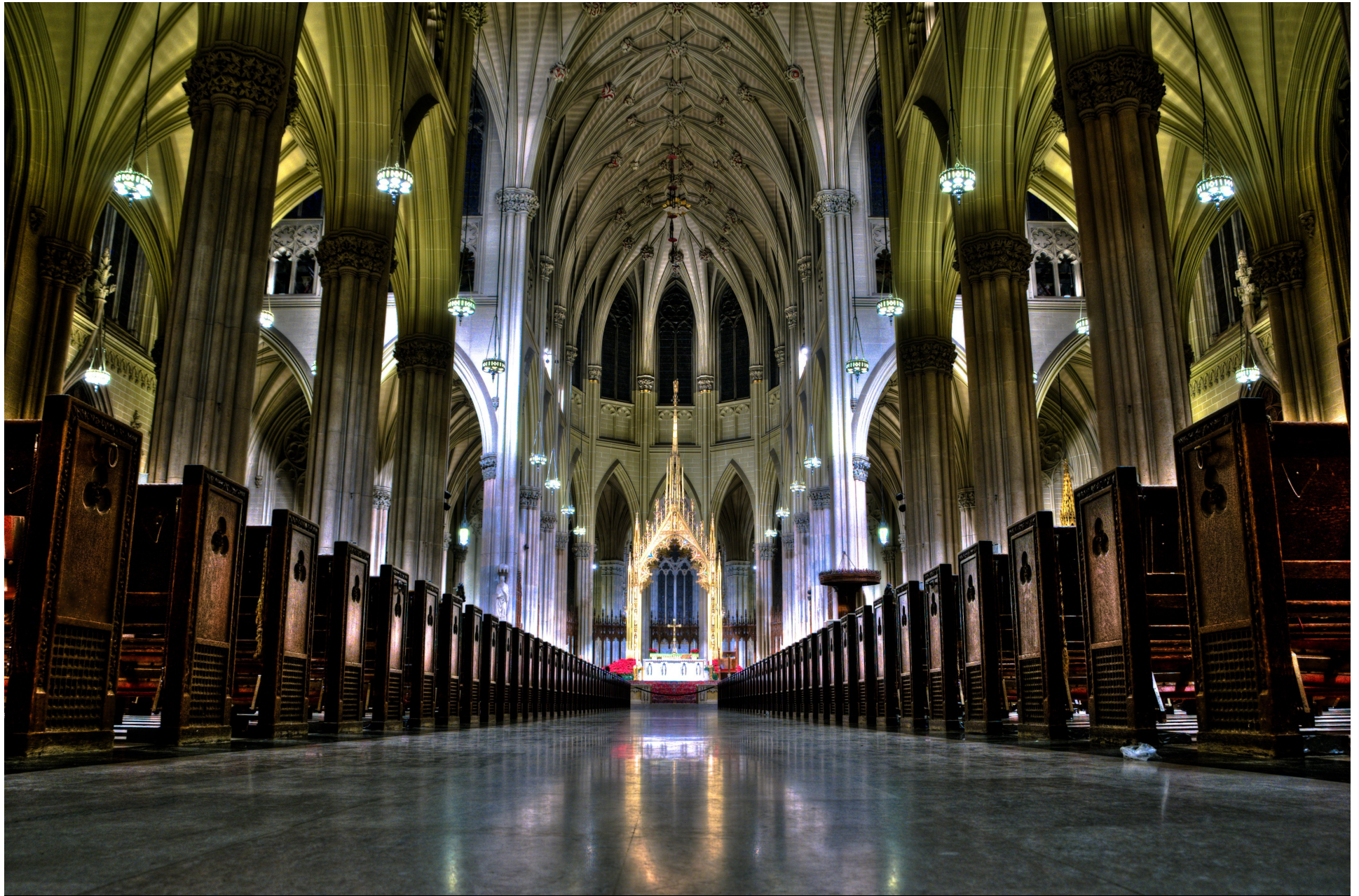
セント・パトリック大聖堂 ( NYC 5番街 )