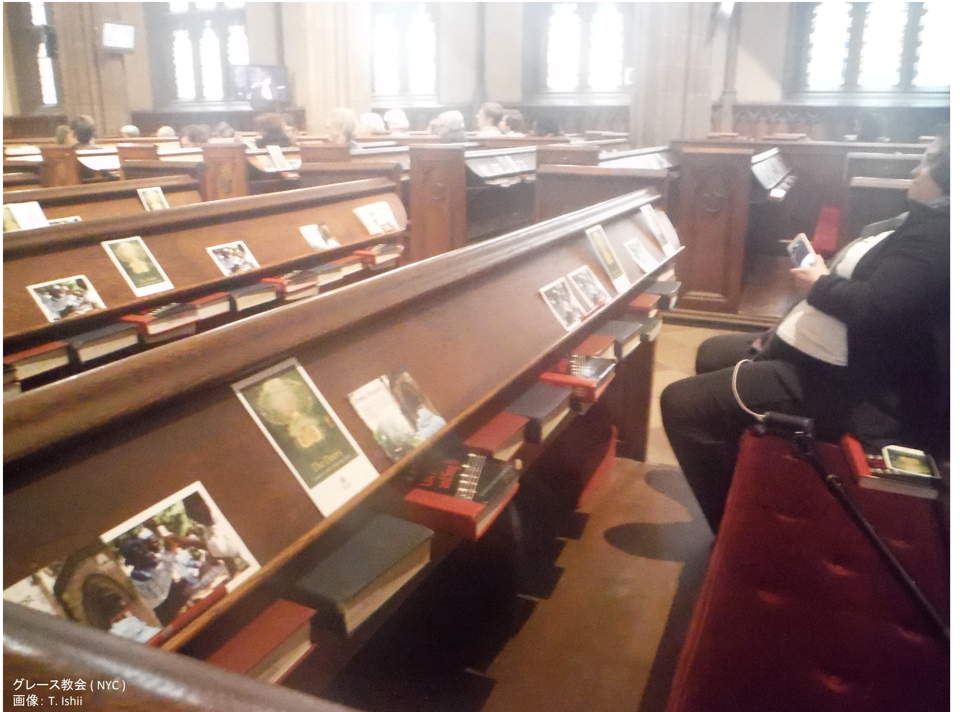
グレース教会 (NYC)