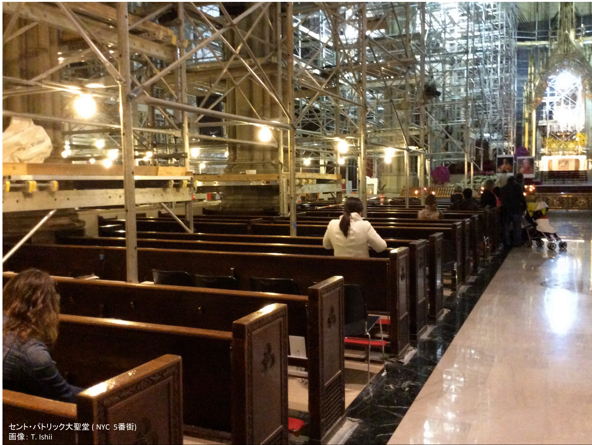
セント・パトリック大聖堂 (NYC 5番街)