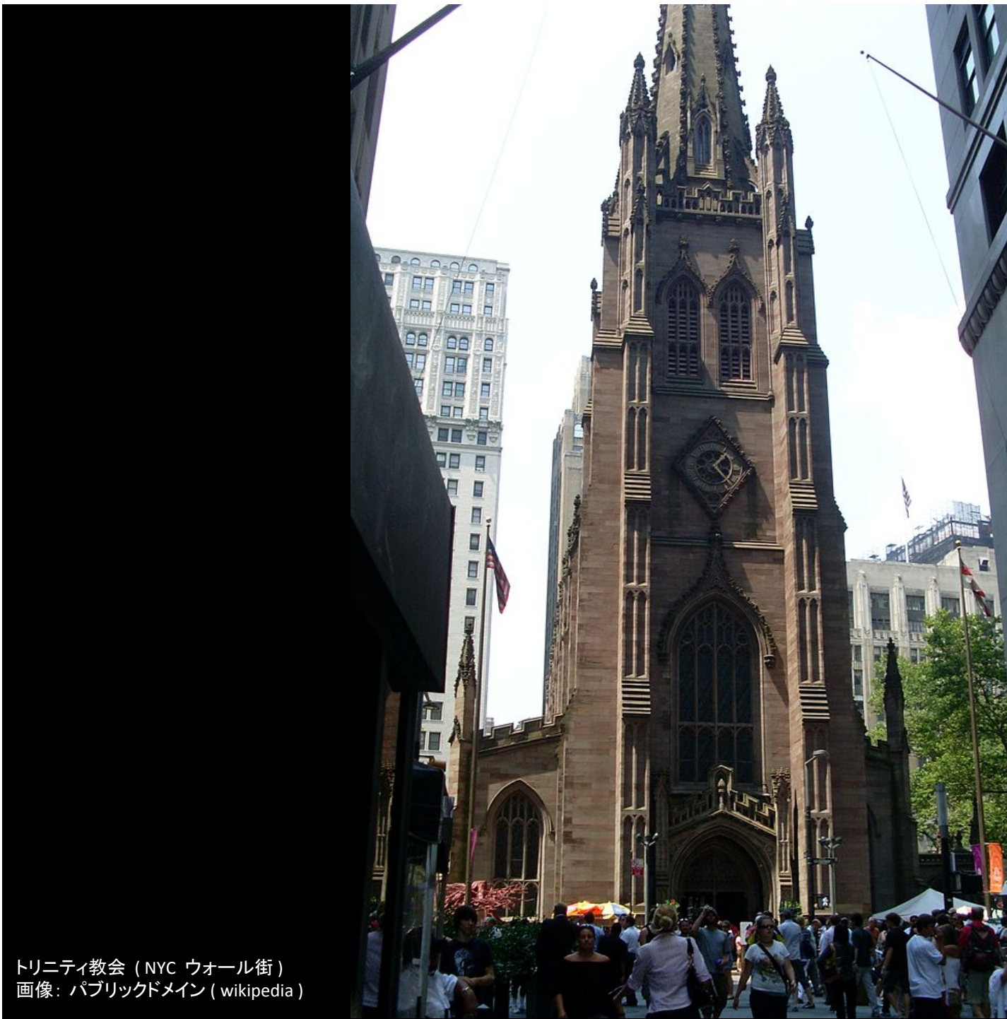
トリニティ教会 (NYC ウォール街)