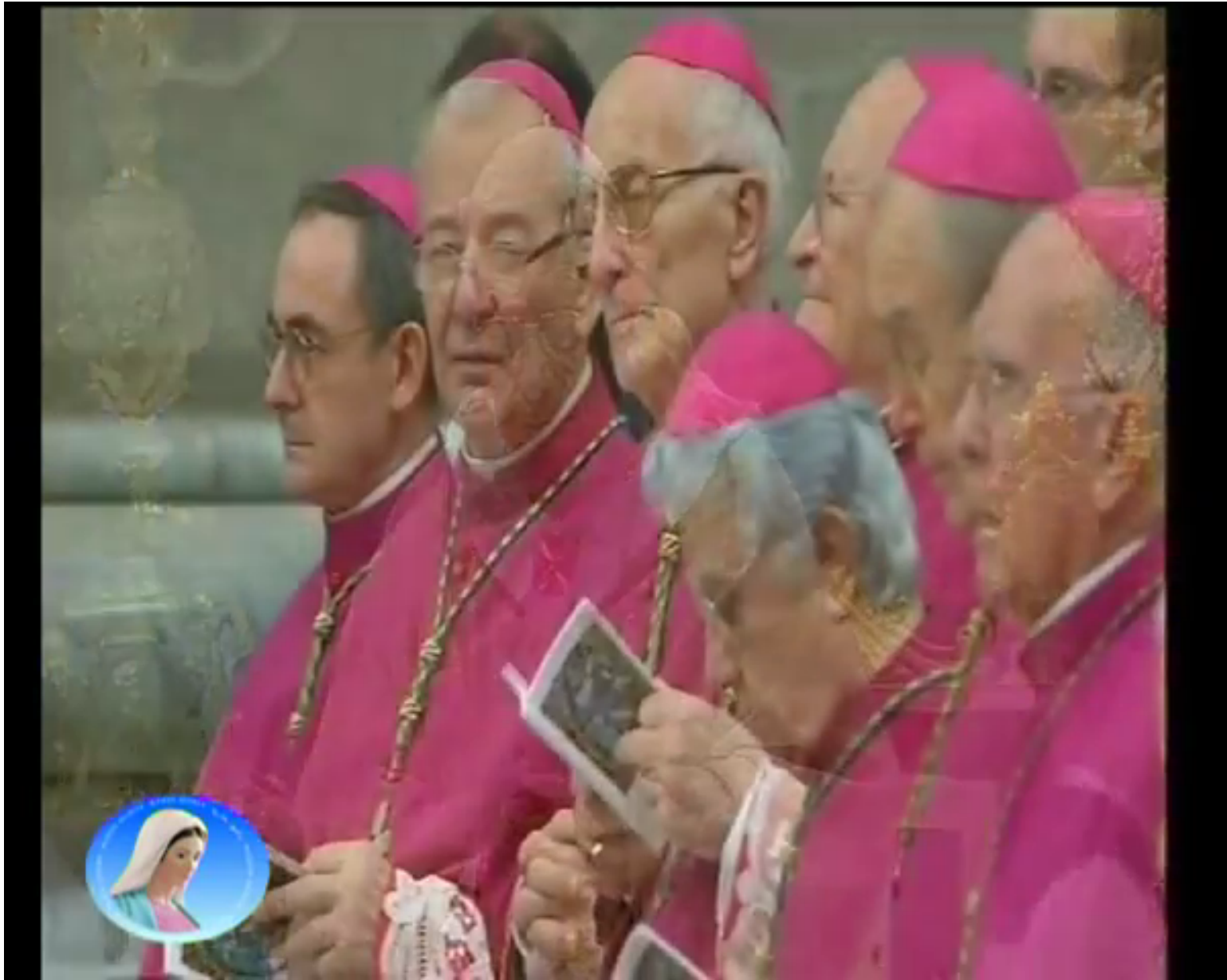
「サンピエトロ大聖堂」(ヴァチカン)での「ミサ」で歌われる「キリエ・エレイツソン」(映像 3:00程度)