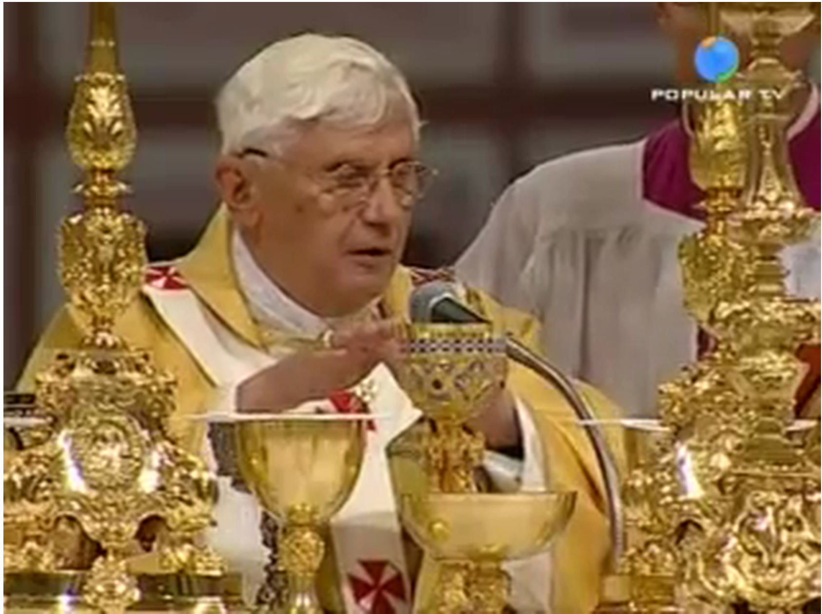
「サンピエトロ大聖堂」(ヴァチカン)での「ミサ」より、「感謝の典礼」と「交わりの儀」の部分。 先代のローマ教皇 ヴェネデクト 16世による。(4分程度)